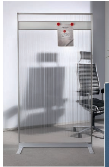
Sichtschutz und Transparenz im Büro: Der neue „magnetoplan Raumteiler Textil“ lässt sich effektiv mit den „Raumteilern aus Acryl“ kombinieren.