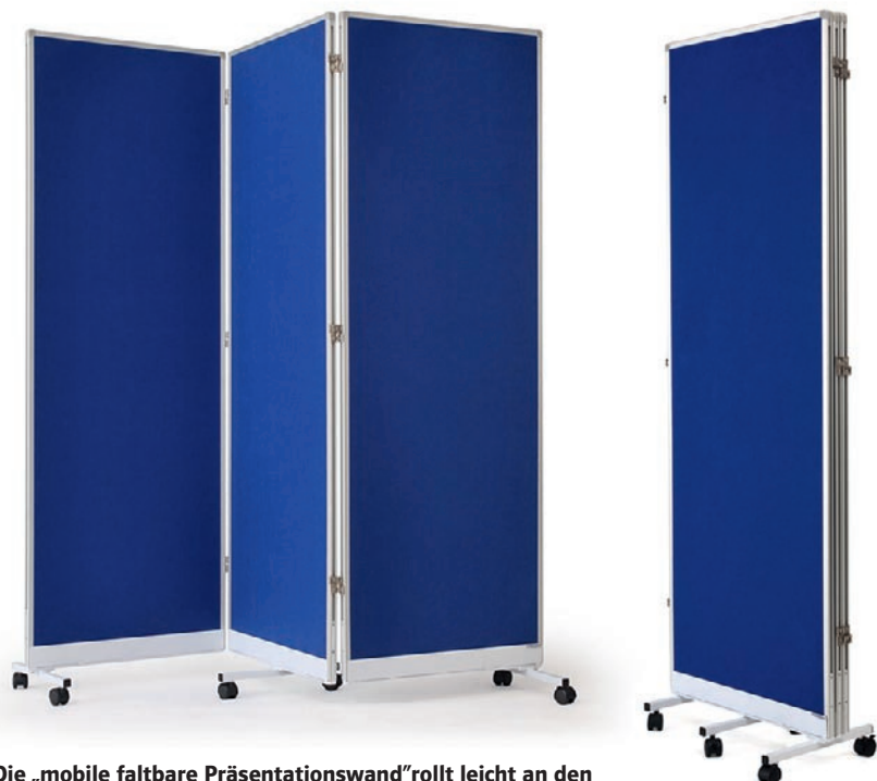
Die „mobile faltbare Präsentationswand“ rollt leicht an den gewünschten Einsatzort und lässt sich zusammengeklappt auf engstem Raum lagern.