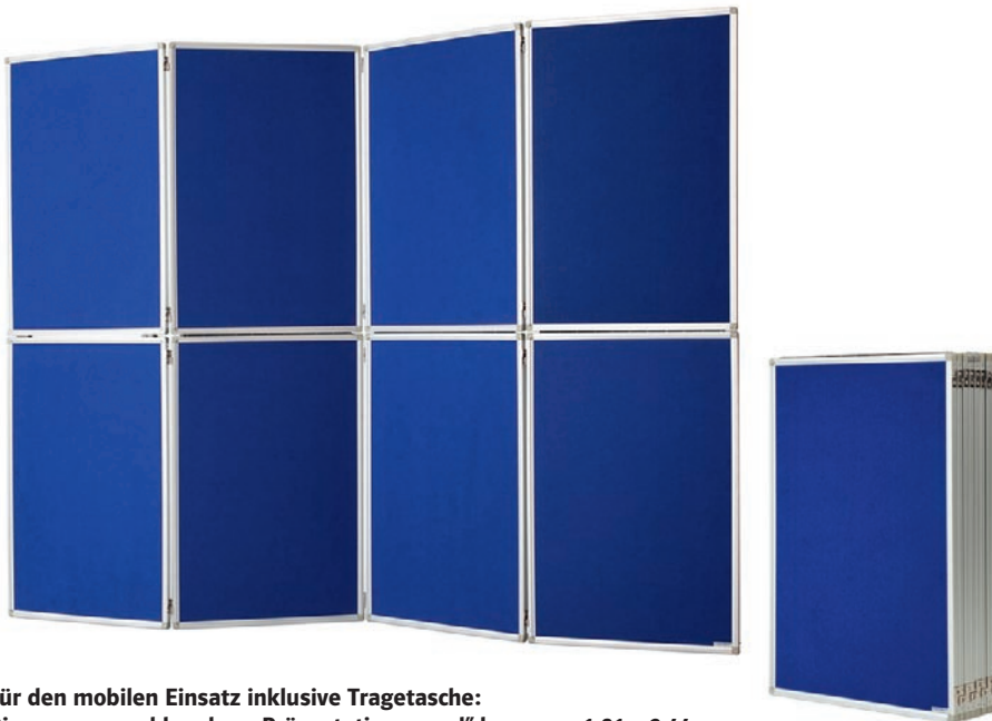
Für den mobilen Einsatz inklusive Tragetasche: Die „zusammenklappbare Präsentationswand“ kann von 1,81 x 2,44 m auf 90,5 x 60 cm (H x B) „verkleinert“ werden.

sammengeklappt werden und ist in einer Tragetasche erhältlich. Hierzu wird die mit Klettbindern befestigte obere Hälfte der Wand vollständig umgeklappt. Mit einer Höhe von nur noch 90,5 cm, einer Tiefe von 8 cm und einem Gewicht von 12 kg kann sie so komfortabel transportiert werden. Vor Ort ist die Präsentationswand dann ohne Zuhilfenahme von Werkzeug sofort einsatzbereit. Mit der doppelseitigen Filzoberfläche lässt sie sich leicht und flexibel wie ein Paravent aufstellen und erreicht eine Größe von insgesamt 1,81 m x 2,44 m (H x B). Mit Pinn-Nadeln können auch hier Poster und Informationen beidseitig befestigt werden, und auch hier bringt der Aluminiumrahmen die nötige Stabilität.