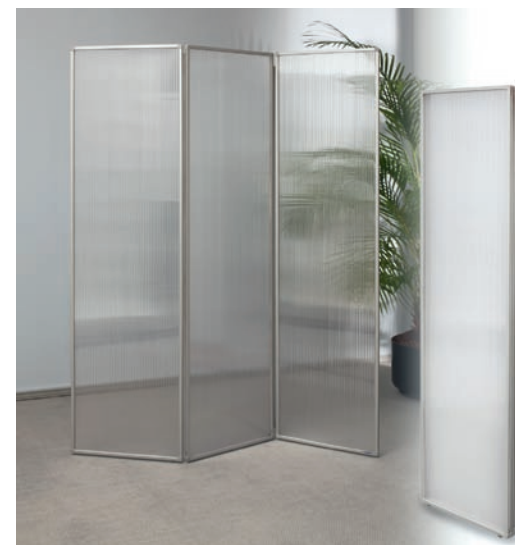
Die „faltbare Acrylwand“ eignet sich besonders zum flexiblen Abtrennen von Besprechungsecken, Arbeitsbereichen etc.

mögliche Flexibilität wünscht, ist mit der „zusammenklappbaren Präsentationswand“ optimal ausgestattet: Diese Variante mit royalblauer Filzoberfläche kann für den Transport komplett zu-