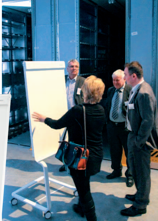
Design als Botschafter: Das Flipchart „evolution plus“ überzeugte schon bei der ersten Produktvorstellung mit innovativer Höhenverstellung und eindrucksvollen Detaillösungen

Mit der Aufgabe, ein ebenso ansprechendes wie modernes Design zu schaffen, wurde der Produktdesigner Oliver Neuland, der als Dozent einer Designschule in Auckland/Neuseeland arbeitet, betraut. Er sollte unter anderem die Magnetoplan-Schreib- und Plantafeln mit einem Plus an Funktion, Ästhetik und Komfort versehen. So wurden die runden Kunststoff-Ecken der „ferroscript“- „CC“- und „SP“-Tafeln wieder durch eine Gehung ersetzt: Die Rahmen sind jetzt durch einen schmalen Einsatz verbunden, der eine leichte, gefällige Rundung entstehen lässt. Für jedes dieser Tafelsysteme mussten die modifizierten Eckverbinder separat entwickelt und angepasst werden. Auch die bewährten Moderationstafeln wurden mit einem innovativen Funktionsdesign modifiziert. Gelungen ist das Oliver Neuland zum Beispiel durch eine beeindruckende Höhenverstellung, die es dem Nutzer erlaubt, die Tafeln komplett bis zum Boden abzusenken sowie bis auf eine stattliche Höhe von 2,10 Meter hochzufahren. Mit den neu entwickelten, einklappbaren Standfüßen aus hellgrauem Kunststoff inklusive feststellbaren Laufrollen lassen sie sich auch auf Teppich und Laminat problemlos nutzen. Die abgerundeten Eckwinkel aus hellgrauem ABS-Kunststoff verleihen auch den Moderationstafeln eine stärkere Identität.